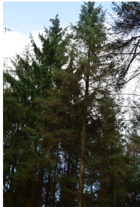
Abb.1 Befallene Sitkafichte

Eiablage Im Spätsommer legen die Fichtenröhrenlausweibchen an den Nadelunterseiten der unteren Kronenbereiche ihre Wintereier ab, welche bis zum Schlupf im Februar/März selbst starke Fröste überstehen. Die aus diesen Eiern schlüpfenden Läuse verursachen nur verhältnismäßig geringe Schäden.