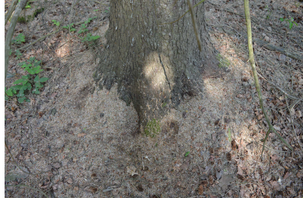
Abb. 2, 3: Typische Symptome: gelbe Bänderung (Bild links, Rotfichte) und Nadelabwurf (rechts, Sitkafichte)