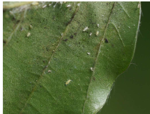
Abb. 4, 5: Lindenblätter mit oberflächlichem Honigtau und an der Blattunterseite mit Blattläusen