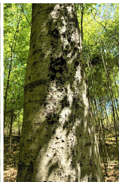
Bild 7: Abplatzende Rinde [ggf. mit weißem „Puder“ unter der Rinde = Nebenfruchtform des Pilzes „Pfennig-Kohlenkruste“ ( Biscogniauxia nummularia )]