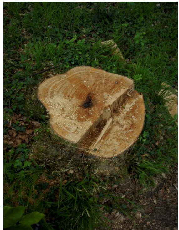
Bild 4: Rechts: trockene Stubben zeigen den Trockenstress gefällter Buchen deutlich an