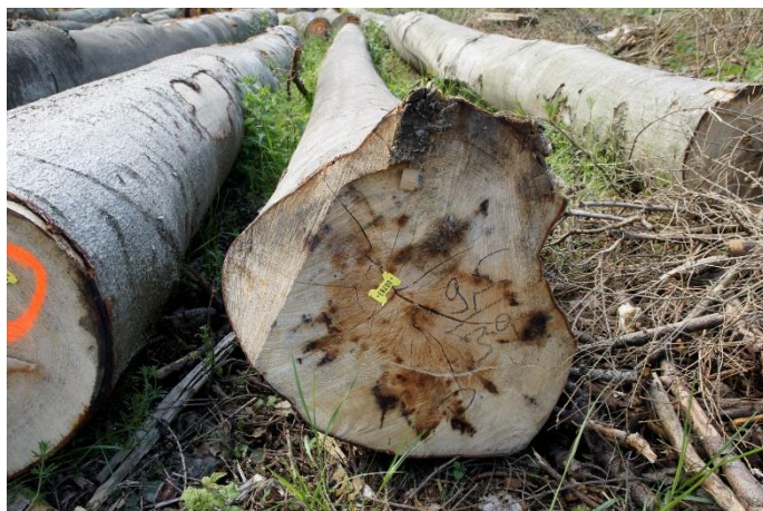
Bild 3: Links: Schwarze, durch Lufteintritt verursachte Verfärbungen an den Stirnflächen