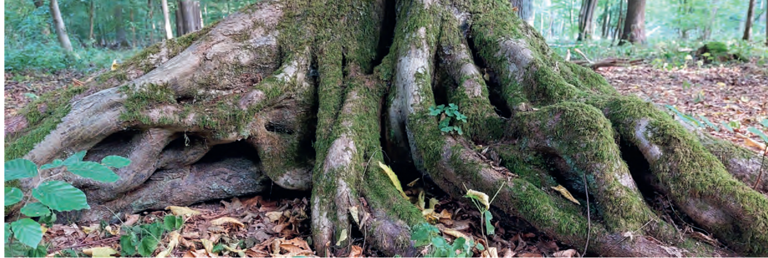
Stammfuß einer alten Hainbuche mit ausgeprägten Mikrohabitatstrukturen in Lippetal.

Wald und Holz NRW verfolgt konsequent das Prinzip der Nachhaltigkeit: Es wird grundsätzlich nicht mehr Holz eingeschlagen als nachwächst. Die schweren Schäden der vergangenen Jahre lassen auf Forstamts-ebene zurzeit keine konkreten Angaben zum Holzzuwachs zu. Die neue Landeswaldinventur wird hierzu Daten liefern.